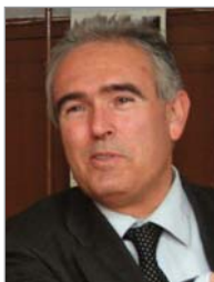
Raül Font-Quer Plana Gobernador del Distrito 2202