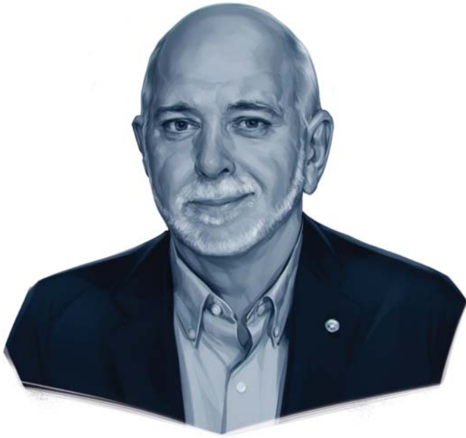
Ilustración de Viktor Miller Gausa